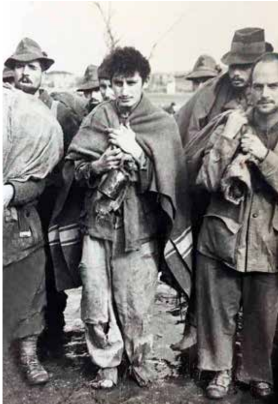
Ιταλοί αιχμάλωτοι των Γερμανών από το στρατόπεδο της Νεραΐδας