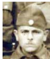
Ο Βουνεσιώτης ήρωας Βασίλης Αλεξανδρής

Ακολούθως, οι Ιταλοί κατακτητές πήγαν στο Βουνέσι, το οποίο είχαν εγκαταλείψει σχεδόν όλοι οι κάτοικοι. Προηγήθηκε μάχη μικρής διάρκειας στην είσοδο του χωριού από ένοπλους αντάρτες του ΕΛΑΣ, οι οποίοι επιχείρησαν να εμποδίσουν τους Ιταλούς να εισέλθουν στο χωριό. Από τα πλέον των 300 οικιών και στάβλων που είχε το χωριό, μόνο 6 σπίτια σώθηκαν καθώς η φωτιά έσβησε λόγω έλλειψης οξυγόνου και οι ζημιές σε αυτά ήταν περιορισμένες.