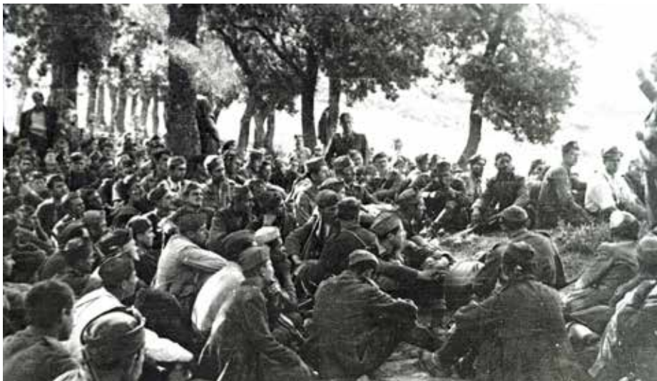
Στιγμιότυπο από το Α' Πανθεσσαλικό Συνέδριο ΕΑΜ

Το 1943 έδειχνε ότι θα είναι μια ελπιδοφόρα χρονιά για την Εθνική Αντίσταση, καθώς τα χωριά της Νευρόπολης συμμετείχαν σύσσωμα στο αντάρτικο το οποίο γιγαντώθηκε. Στις 12 Μάρτη 1943, τμήματα του ΕΛΑΣ κατεβαίνουν από τα ορεινά και απελευθερώνουν την Καρδίτσα από τους Ιταλούς, καθιστώντας την ελεύθερη πρωτεύουσα της Ευρώπης, όπως ανέφερε το BBC αναγγέλοντας την είδηση. Την ίδια εποχή στο οροπέδιο της Νευρόπολης κατασκευάζεται το αντάρτικο «αεροδρόμιο – φάντασμα». Στις 26 Ιουλίου του 1943, συνέρχεται το Α' Πανθεσσαλικό Συνέδριο του ΕΑΜ, με συμμετοχή 4.000 αντιπροσώπων απ' όλες τις ΕΑΜικές οργανώσεις της Θεσσαλίας στο μοναστήρι της Κορώνας.