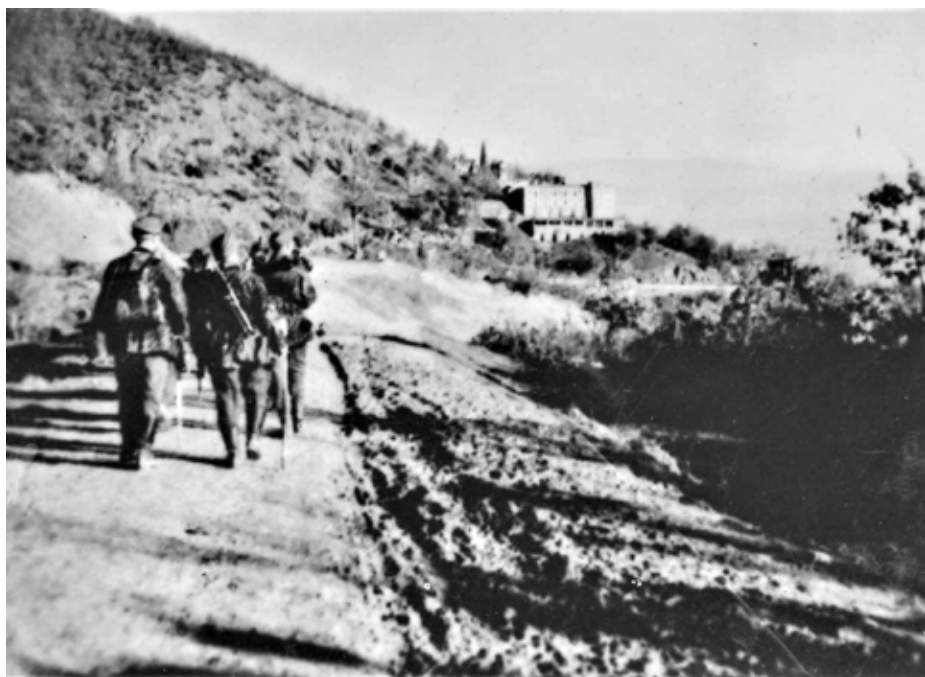
Γερμανοί στρατιώτες στις 3/12/1943, προσεγγίζουν το μοναστήρι της Κορώνας, το οποίο σε λίγο ώρα θα κάψουν