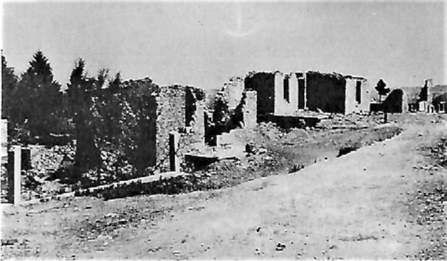
Ολοκληρωτική η καταστροφή της Νεράιδας. Οι Γερμανοί ανατίναξαν ακόμη και τις πηγές.

θα επιστρέψουν ίσως 4.000. Οι υπόλοιποι; Άλλοι χάθηκαν, άλλοι παρέμειναν σε κάποιο χωριό, άλλοι πέθαναν από το κρύο και από την πείνα. Μερικούς αντάρτες τους πήρε και αυτούς για πάντα ο πάγος τα βράδια που πέρασαν στους πρόχειρους καταυλισμούς», θα γράψει ένας Ιταλός ερευνητής.