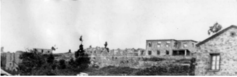
Νεράϊδα καλοκαίρι 1953, δέκα χρόνια μετά τα αποκαΐδια είναι εδώ.