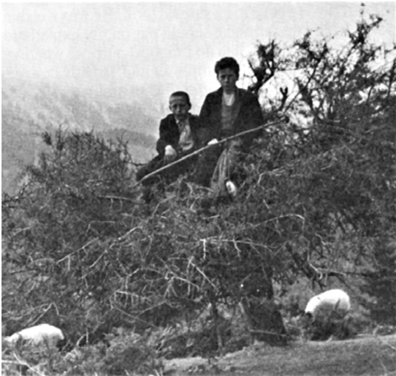
Έφηβοι βοσκοί στην Νεραίδα. Φωτ. Άγγλου αξιωματικού, αρχές Οκτώβρη 1943

* «Άγγελος Ζαχαρόπουλος. Τα ταραγμένα χρόνια 1940-1950. Άγραφα Εφηβικές μαρτυρίες και αναμνήσεις», σελ.69 -72, εκδόσεις ΜΙΝΩΑΣ, 2008.