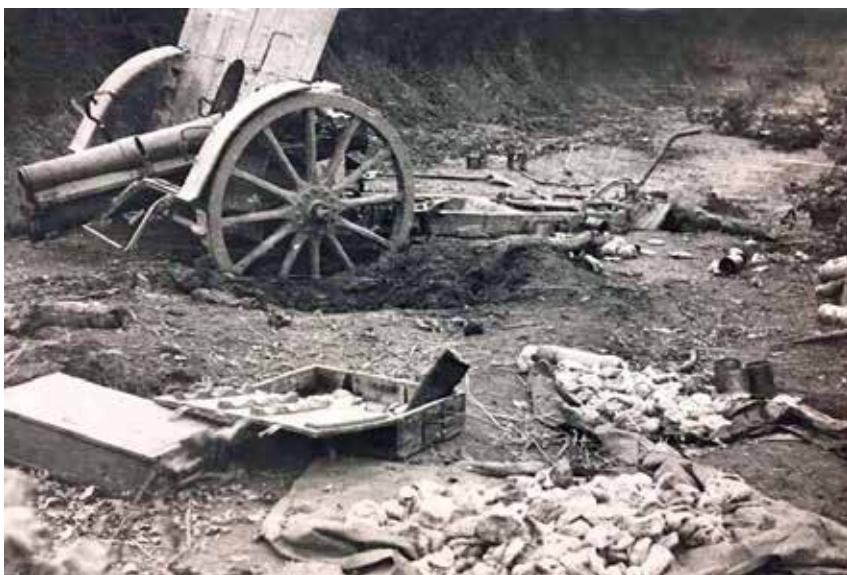
Το Ιταλικό κανόνι που εγκατέλειψε ο ΕΛΑΣ στη μάχη της Νευρόπολης.