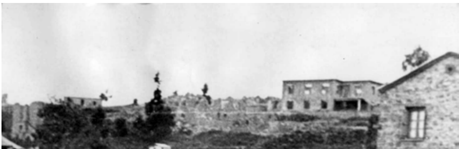
Νεράιδα καλοκαίρι 1953, δέκα χρόνια μετά τα αποκαϊδια είναι εδώ.

Ως σύμβολο φιλίας και αδελφοσύνης, όπως αυτές διαμορφώθηκαν στην πολύμηνη φιλοξενία, κάτω από τις πλέον αντίξοες συνθήκες, πολλών χιλιάδων Ιταλών στις οικογένειες των χωριών των νομών Καρδίτσας και Τρικάλων.