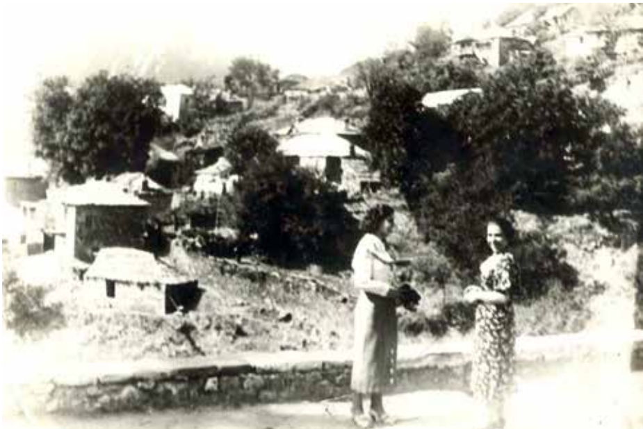
Άποψη της Καρύτσας πριν απ' το κάψιμο του χωριού. Αυτή ακριβώς την εικόνα έβλεπαν οι Γερμανοί στις 29-11-1943, όταν πυρπολούσαν το χωριό απ' το προαύλιο του Αη-Γιάννη.

Απ' το φθινόπωρο, κιόλας, του 1942 άρχισε στην περιοχή μας να φουντώνει το αντάρτικο και η Αντίσταση κατά των εχθρικών στρατευμάτων κατοχής, κίνημα που μέρα με τη μέρα γιγαντώνονταν. Τον επόμενο χρόνο (1943) το κίνημα αυτό είχε κυριολεκτικά θεριέψει. Η Καρύτσα Δολόπων (Ευρυτανίας τότε), ευρισκόμενη σε υψόμετρο 1.180 μέτρων και φυσικά οχυρωμένη από πανύψηλες βουνοκορφές των Αγράφων, αποτέλεσε κέντρο σημαντικών δραστηριοτήτων του ΕΑΜ και έδρα πολλών αντάρτικων συνεργείων που λειτουργούσαν ασταμάτητα [όπως τα