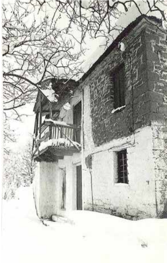
Το παλιό δώροφο σπίτι της οικογ. Γιαταγάνα στην Καρύτσα, όπου ήταν εγκατεστημένο το Τοπογραφείο του ΕΑΜ και της Αντίστασης.

το Νεοχώρι, που υπήρξε αυτόπτης μάρτυρας αυτής της συμφοράς, κρυμμένος κι ο ίδιος στα βουνά της Καρύτσας, διηγείται με τραγική γλαφυρότητα και ως εξής το θλιβερό αυτό συμβάν: "Την άλλη μέρα (29-11-1943) ο χειμωνιάτικος ουρανός παρουσιάστηκε χωρίς ίχνος σύννεφο. Ένας ήλιος λαμπρός φώτισε την Καρύτσα με τις άσπρες στέγες των σπιτιών της. Καθώς το χωριουδάκι φωτίστηκε από τον ήλιο, έμοιαζε με βλαχοπούλα καθισμένη στη γραφική πλαγιά, να γνέθει τη ρόκα της. Το ειδυλλιακό χωριό επρόκειτο αυτή την ημέρα να μεταβληθεί σε κόλαση. Το πυρπόλησαν οι Γερμανοί. Οι κάτοικοί του παρακολουθούσαν από την απέναντι βουνοκορφή. Με σφιγμένη την ψυχή έβλεπαν τα σπίτια τους να γίνονται παρανάλωμα και να ορθώνονται κατόπιν μισογκρεμισμένοι, καπνισμένοι τοίχοι. Κανένας δεν έκλαψε. Ούτε οι γυναίκες, ούτε ακόμη τα παιδιά. Ήξεραν ότι αυτοί που έκαιγαν τα σπίτια και σκότωναν αμάχους, ήταν μια κακοποιός δύναμη και μαζί της δεν χωρούσε κανένας συμβιβασμός. Έπρεπε να πολεμηθεί από όλους μέχρι τέλους, ως την τελική νίκη. ..." 10