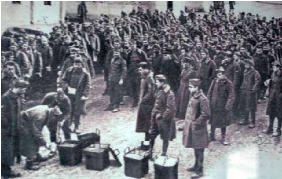
Συσσίτιο Ιταλών αιχμαλώτων (1943)

Αυτή η φιλοξενία των χιλιάδων Ιταλών στα Αγραφιώτικα χωριά, πολλοί εξ αυτών σε σπίτια που έκαψαν οι ίδιοι οι Ιταλοί, στοιχειοθετεί μέγιστη ανθρωπιστική αντιμετώπιση, ψυχικό σθένος και μεγαθυμία που δεν απαντάται εύκολα στην παγκόσμια Ιστορία. Οι πρόγονοί μας είναι ίσως από τα ελάχιστα, αν όχι μοναδικά, παραδείγματα στον κόσμο, όπου οι κατεστραμμένοι περιθάλπουν και φιλοξε-