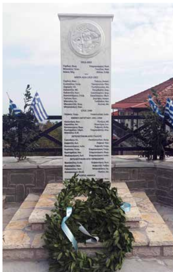
Μνημείο Πεσόντων στους Εθνικούς Αγώνες στο Μορφοβούνι, 2022.