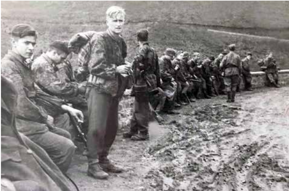
Γερμανική μονάδα κάτω από την Κορώνη, λίγο πριν το κάψιμο του μοναστηριού, 3/12/1943

Μεσενικόλας: Κήκαν από τα 222 σπίτια από τα 309 και εκτελέστηκαν οι άμαχοι: Ζαχαρή Χαρίκλεια, Καρασιώτος Αναστάσιος, Μαστραπάς Γεώργιος, Μηλιώνης Ιωάννης, Μηλιώνης Ευάγγελος, Τσιλιώνης Σωτήριος, Τσαγανός Βασίλειος, Σφέτσιου Αριστέα. Επίσης οι Γερμανοί σκότωσαν σε άλλη χρονική στιγμή τους: Καραμήτρο Δημήτριο, Καραμήτρο Γεώργιο, Καλαμάτα Αριστέιδη, Μπαλάφα Γεώργιο και Μπουμπουλίδη Σωτήριο.