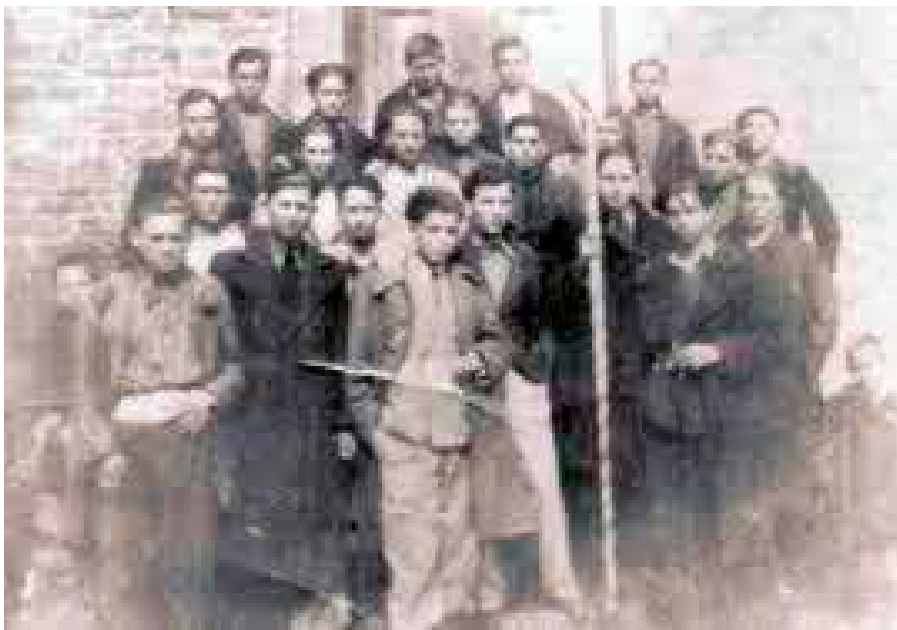
Νέοι της ΕΠΟΝ Μεσενικόλα, 1943