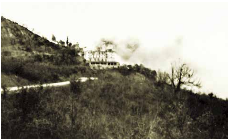
Οι Γερμανοί καίνε το μοναστήρι της Κορώνας, 3/12/1943