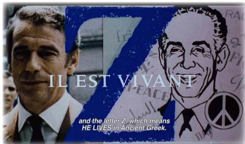
Την ιστορία της δολοφονίας του Γρηγόρη Λαμπράκη περιγράφει ο Βασίλης Βασιλικός στο βιβλίο του "Ζ: Φανταστικό ντοκιμαντέρ ενός εγκλήματος" του 1966.

πολιτισμού κι αυτού του ανθρώπου. Είναι καθήκον του κάθε δημοκρατικά σκεπτόμενου Έλληνα να διαφυλάξει και πάλι σήμερα τις αρχές της δημοκρατίας και του σεβασμού των ανθρωπίνων δικαιωμάτων ως κόρη σφραγισμένου. Φάρροι που δείχνουν τον σωστό δρόμο υπάρχουν στους λαϊκούς αγώνες πάρα πολλοί. Ένας λαμπρός και πάντα ξεχωριστός εν μέσω αυτών ο Ειρηνιστής Μαραθωνοδρόμος, ανθρωπιστής, εξαιρετος επιστήμονας και αγνός δημοκράτης, ο αείμνηστος Γρηγόρης Λαμπράκης. Τούτη η παρέμβαση στην εφημερίδα μας να αποτελέσει για όλους εμάς τους Έλληνες δημοκράτες πολίτες και δη τους Μορφοβουνιώτες, τον ελάχιστο φόρο τιμής σε τούτο το άξιο τέκνο της δημοκρα-