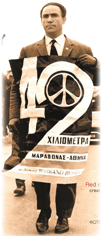
Ο Γρηγόρης Λαμπράκης στην Α' Μαραθώνια Πορεία τον Απρίλη του 1963

κυκλο έγινε αμέσως μετά από τη συγκέντρωση που είχε οργανώσει στη Θεσσαλονίκη η τοπική οργάνωση της ΕΕΔΥΕ, στα γραφεία του Δημοκρατικού Συνδικαλιστικού Κινήματος, και ενώ ο Λαμπράκης κατευθυνόταν με τα πόδια στο ξενοδοχείο που είχε καταλύσει. Στη διάρκεια αντισυγκέντρωσης, λίγα μέτρα μακρύτερα, χτυπήθηκε από τραμπούκους και αστυνομικούς και μεταφέρθηκε στο νοσοκομείο ο βουλευτής Καβάλας της ΕΔΑ και μέλος του ΚΚΕ, Γιώργης Τσαρουχάς, ο οποίος στην επάρατη δικτατορία δολοφονήθηκε ως γνωστό στην Ασφάλεια μετά από φρυ-