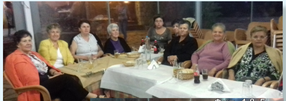
ΦΩΤ. 4 & 5

Θερμές ευχές σε όλους τους συγχωριανούς και αναγνώστες της Μορφοβουνιώτικης Φωνής για καλό χειμώνα και υγεία στον καθένα χωριστά και τις οικογένειές σας.