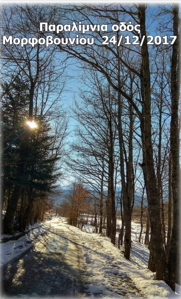
Παραλίμνια οδός Μορφοβουνίου 24/12/2017

Θερμά συγχαρητήρια σε όλους και καλή πρόοδο!