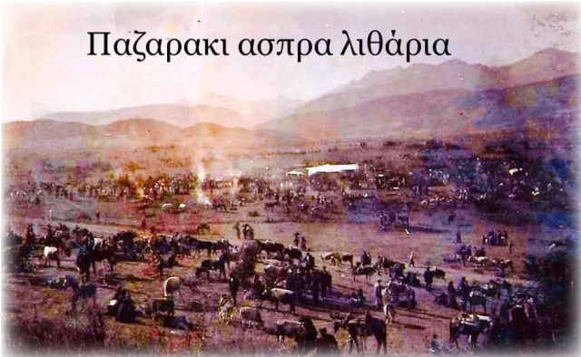
Παζαρακι ασπρα λιθάρια