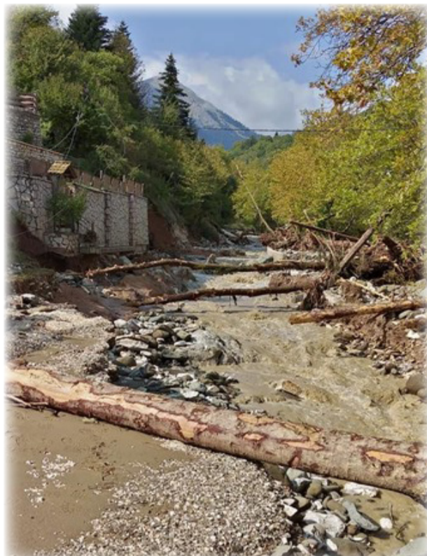
Ο δρόμος Πεζούλας – Φυλακτής έγινε κοίτη ποταμού

στο οποίο αναφέρονται οι καταστροφές στο Δήμο Λίμνης Πλαστήρα, καθώς και προτάσεις για την αντιμετώπιση των προβλημάτων στο Δήμο. Επιπλέον στην ομιλία του επεσήμανε ότι η ορεινή Καρδίτσα δεν προβλήθηκε, αλλά οι ζημιές είναι εξίσου σοβαρές με τις άλλες περιοχές και ζήτησε αναλογικά δίκαιη χρηματοδότηση.