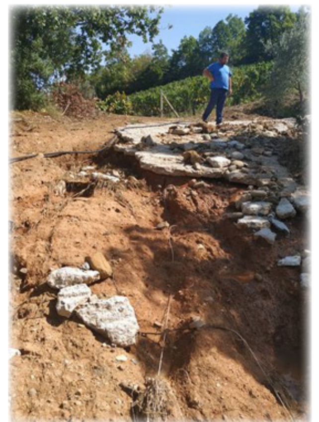
Αγροτικός δρόμος εξαφανίστηκε

Καλούνται οι πληγέντες να καταθέσουν άμεσα αιτήσεις στο Δήμο Λίμνης Πλαστήρα, προκειμένου να επισκεφθεί η Επιτροπή για να αξιολογήσει τις ζημιές για να καταβληθούν άμεσα οι αποζημιώσεις.