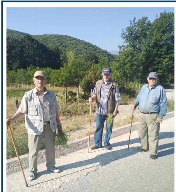
Παλαίμαχοι Βουνεσιώτες Ολυμπιονίκες

Συνέχιση των εκδηλώσεων ολόκληρο το χρόνο μέχρι τον Μάιο του 1922 Πανελλήνιο Συνέδριο με θέμα η Εννοια της Ελευθερίας μέσα από το Δημοτικό Τραγούδι.