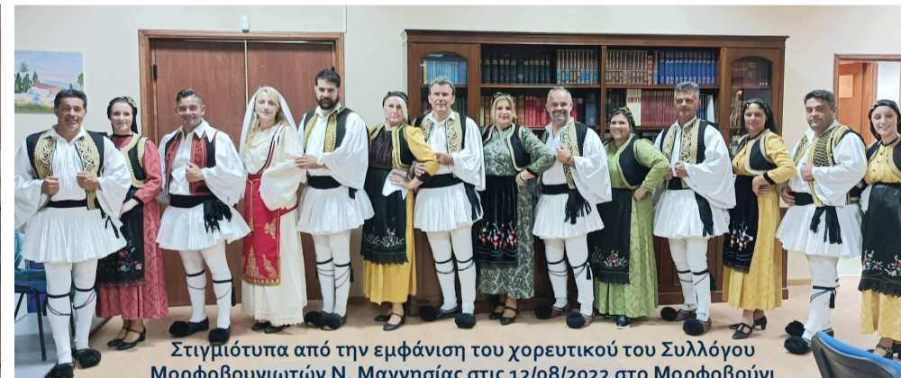
Στιγμιότυπα από την εμφάνιση του χορευτικού του Συλλόγου Μορφοβουνιωτών Ν. Μαγνησίας στις 12/08/2022 στο Μορφοβούνι