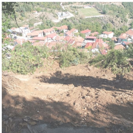
Κατολίσθηση του δάσους στη θέση «Μισιακιά», καταπλάκωσε σπίτια αφανίζοντάς τα κυριολεκτικά.

Ειδικότερα στο Μορφοβούνι, οι ζημιές είναι τεράστιες ζημιές, διότι ενεργοποιήθηκαν κατολισθητικά φαινόμενα, σε επιβαρυσμένες από το παρελθόν περιοχές, υπάρχουν γνωματεύσεις του ΙΓΜΕ για κατολισθήσεις που έγιναν στα μεταπολεμικά χρόνια και υποδείξεις που ποτέ δεν λήφθηκαν υπόψη. Τώρα όμως είναι ώρα ευθύνης και όχι αναζήτησης των ευθυνών.