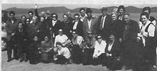
Όλη η παρέα με φόντο τη λίμνη Πλαστήρα.