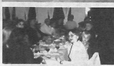
Όλη η παρέα στο τραπέζι που διοργάνωσε ο σύλλογος στην καφετέρια του χωριού.