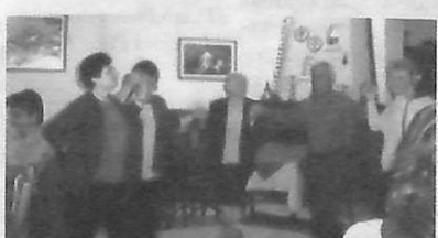
Συντά και τσάμικα ανέβασαν τη διάθεση μας στο έπακρον.