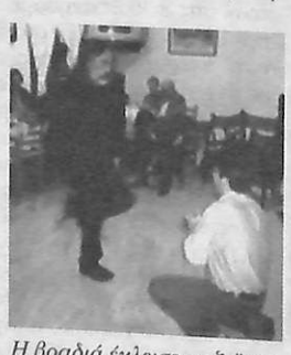
Η βραδιά έκλεισε με ζέμπεκιές