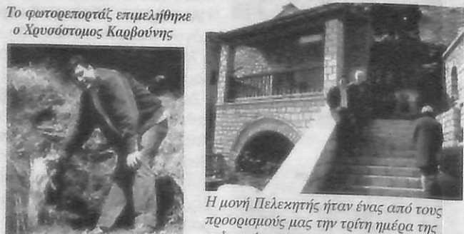
Η μονή Πελεκητής ήταν ένας από τους προορισμούς μας την τρίτη ημέρα της εκδρομής μας.