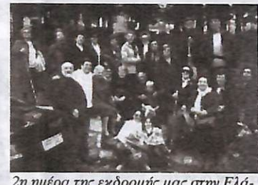
2η ημέρα της εκδρομής μας στην Ελάτη. Αναμνηστικές φωτογραφίες.