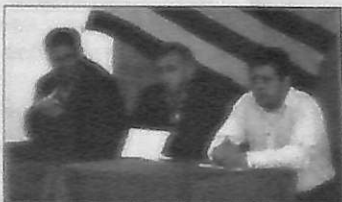
Το απόγευμα του Σαββάτου πραγματοποιήθηκε η ημερίδα που αφορούσε το μέλλον του Μεσενικόλα.