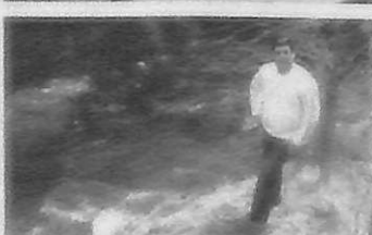
Ο πρόεδρος και ο γραμματέας του συλλόγου μαγεμένοι από τις ομορφιές της φύσης στο Πετρούλι.