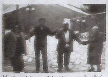
Μετά από ένα καλό γεύμα ακολουθεί πάντοτε χορός.