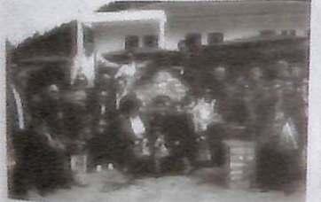
2η ημέρα της εκδρομής μας στην Ελάτη. Αναμνηστικές φωτογραφίες.