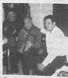
Ο μάστορας έδωσε κέφι με το δικό του τρόπο στην εκδήλωσή.