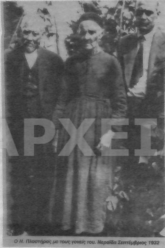
Ο Ν. Πλαστήρας με τους γονείς του. Νερόβια Σεπτέμβριος 1932

Επιμέλεια - παραγωγή: ΔΗΜΟΣΙΟΓΡΑΦΙΚΕΣ ΕΚΔΟΣΕΙΣ Καλαρία ΚΩΝ/ΝΟΣ ΚΥΡΙΑΚΟΠΟΥΛΟΣ ΤΗΛ: 6847794 - 6845288 - FAX: 6842009 e-mail: calavria@acci.gr