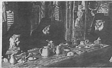
Δείπνο στην «Τράπεζα» της Ι.Μ. Διονυσίου

. Και ό,τι βέβαια έκανε, δεν είπε ποτέ ότι το έκαμε αυτός, ή μόνος του. Με τη