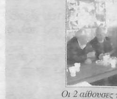
Οι 2 αίθουσες των γραφείων του συλλόγου γέμισαν από Μεσσηνικολίτες όλων των ηλικιών οι οποίοι διασκεδάσαν πίνοντας καλό Μεσσηνικολίτικο κρασί και τραγουτώντας μεζέδες από τον πλούσιο μπουφέ μας.