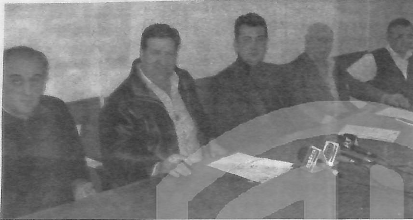
Από τη συνέντευξη τύπου

Αυτό άλλωστε αντικατοπτρίζεται και στο γεγονός πλέον ότι συλλειτουργούν - συμμετέχουν στο πρόγραμμα Interreg και οι δύο όμοροι παραλίμνιοι Δήμοι Νεβρόπολης και Ιτάμου και τους ευχαρι-