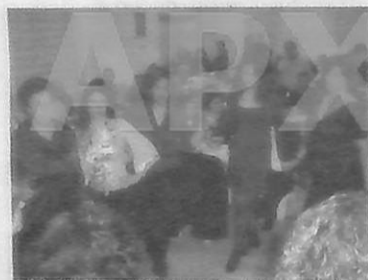
Το χορευτικό τμήμα Μεσενικόλα στην πρώτη του εμφάνιση μπροστά σε κοινό άφησε πολύ καλές εντυπώσεις.