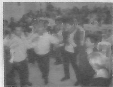
Η πίστα δεν έμεινε άδεια ούτε στιγμή. Οι γυναίκες ως επί το πλείστον ήταν πιο εκδηλωτικές. Όμως όλοι οι χωριανοί χόρεψαν από δημοτικά μέχρι βαριά ζεϊμπέκικα.