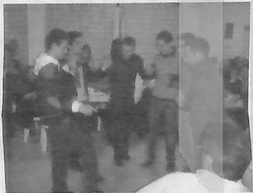
Η ομάδα των Λοκατζαραίων