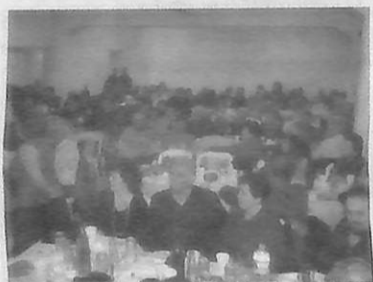
Η αίθουσα του Πνευματικού κέντρου γεμάτη από Μεσενικολίτες που τίμησαν την εκδήλωση.

Ευχόμεστε στους νέους του χωριού να συνεχίσουν με αμείωτο μεράκι και αγάπη για τη διατήρηση των ηθών και εθίμων του χωριού μας γιατί αυτή είναι η πολιτιστική κληρονομιά μας.