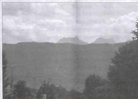
Η οραία κοιμημένη όπως φαίνεται, ανηφορίζοντας προς το Μεσενικόλα