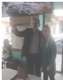
ΤΟ ΔΣ ΤΟΥ ΣΥΛΛΟΓΟΥ

Ευχαριστούμε πολύ για τη συμμετοχή και ευχόμεστε σε όλους μία όμορφη, δημιουργική και γεμάτη υγεία χρονιά και σε πρώτη ευκαιρία να βρεθούμε και πάλι από κοντά κι ακόμα περισσότερο!