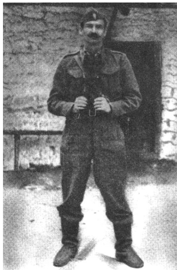
Ο Ανθ'γός Αριστείδης Λαδιάς

Ο Αριστείδης Λαδιάς γεννήθηκε το 1917 στον Μεσενικόλα και υπηρέτησε σαν ανθυπολοχαγός του ελληνικού στρατού όντας απόφοιτος της σχολής Ευελπίδων. Από τα θρανία της σχολής το 1940 πήγε κατευθείαν στο μέτωπο. Πολέμησε γενναία και τραυματίστηκε στο πρόσωπο, αλλά δεν εγκατέλειψε την πρώτη γραμμή του πολέμου. Στην κατοχή, αφού προσπάθησε ανεπιτυχώς να φύγει με υποβρύχιο για τη Μέση Ανατολή, εντάχθηκε στο κίνημα της εθνικής αντίστασης και υπηρέτησε αρχικά ως διοικητής του εφεδρικού ΕΛΑΣ στον τομέα της Νεβρόπολης. Σαν επικεφαλής των ανδρών του τομέα αυτού, πήρε μέρος στην παράδοση του ΕΛΑΣ κατά την πρώτη απελευθέρωση της Καρδίτσας από τους Ιταλούς