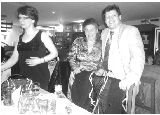
Ευτυχημένα τα μέλη του Δ. Σ. από την επιτυχία που σημείωσε ο χορός