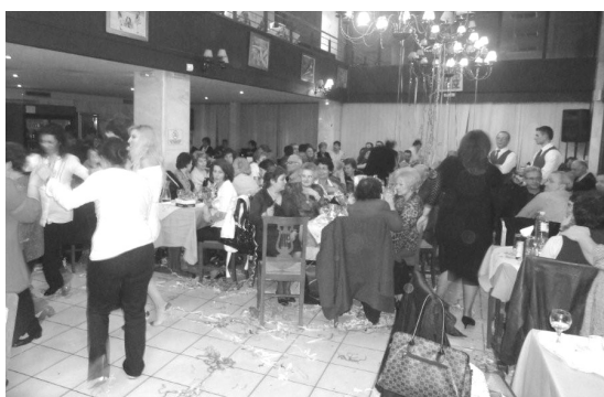
Στιγμιότυπα από την εκδήλωση.