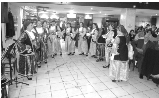
Οι κυρίες του χορευτικού παρουσίασαν ένα ακόμη αξιόλογο πρόγραμμα. Ο Σύλλογος τις αντάμειψε συμβολικά.