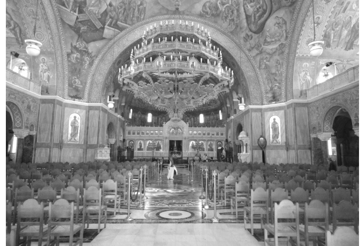
εικόνα του Αγίου συνεχίσαμε για μια βόλτα στην πόλη της Πάτρας για να γνωρίσουμε τις ομορφιές της όπως την πλατεία του Αγίου Γεωργίου, το ρολόι κ.α.