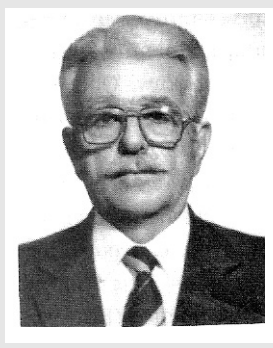
Για να μην είμαστε επιλήσιμονες

Επτά χρόνια πέρασαν από τις 13 του Οκτώβρη του έτους 2004, όταν ο αείμνηστος Γιάννης Παϊζάνος αποδήμησε εις Κύριον. Άφησε τα εγκόσμια και μετακόμισε στη στρατιά των Αγγέλων. Υπήρξε γόνος μιας πολυμελούς οικογένειας και είχε άλλους τέσσερους αδελφούς και δύο αδελφές. Γεννήθηκε στο Μεσσηνολά. Έβγαλε το Δημοτικό Σχολείο στο χωριό και το Γυμνάσιο στη Καρδίτσα. Στη συνέχεια κατετάγη εθελοντής στο στρατεύμα με σκοπό να περάσει στη Σχολή Ευελπίδων. Αγωνίστηκε στον Αλβανικό πόλεμο με το Βαθμό του μονίμου Επιλοχία πυροβολαρχίας. Αργότερα λόγω των συνταρακτικών γεγονότων της εποχής εκείνης δεν φοίτησε στη Σχολή Ευελπίδων που επιθυμούσε, αλλά αναγκάστηκε να