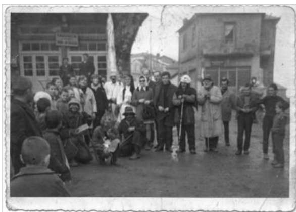
Ομάδα Λοκατζαριών πριν πολλές δεκαετίες, μπροστά από το καφενείο του Καζάση και το κρεοπωλείο του Καρακατσάνη

Οι γιορτές των Χριστουγέννων του νέου έτους και των Φώτων αν και είναι μέσα στην πικυριά του χειμώνα, στα πιδικά μας χρόνια, αλλά και τώρα, έφεραν και φέρνουν, χαρά, και ζεστασιά και ανάταση ψυχής. Το χωριό βρισκόταν σχεδόν καθημερινά σε χαρούμενο αναβρασμό. Αρχίζε από την παραμονή των Χριστουγέννων και τελείωνε τον Γιαννιού.