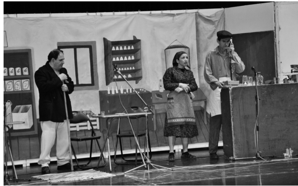
Στιγμιότυπο από τη θεατρική παράσταση «Του χωριού το Κοινοβούλιο»

παρστάσεις στην Αθήνα σε συνεργασία με το Σύλλογο.