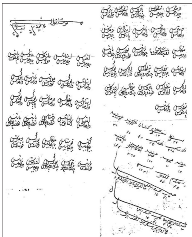
Το πρώτοτυπο χειρόγραφο του 1454

Στον τόμο που εκδόθηκε στην Τουρκία το 2001 και περιλαμβάνει μεταγλωττισμένο στο λατινικό αλφάβητο μεγάλο μέρος όλης της απογραφής υπάρχει και χάρτης όπου σημειώνεται το χωριό μας καθώς και τα γύρω χωριά: Βονίς το Βουνέσι, Παλάζντα το Μπλάζδο, Πορτίτσε το Πορτίτσα, Άγιο Γιώργι ο Αη Γιώργης, Κιρασιά η Κερασιά, Ιστούγκο το Κρουσέρι, Μπιτζίλα η Μπεζούλα, Τατάγι το Λαμπερό κλπ. Ακόμα υπάρχει το Φράγγο , ενώ εκεί που περίπου είναι σήμερα το χωριό Μητρόπολη φαίνεται να υπάρχει οικισμός με το όνομα « Νικόλα Τσαπόκα ».