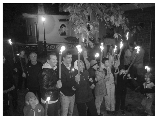
Από τη λαμπαδηδρομία το βράδυ του Σαββάτου