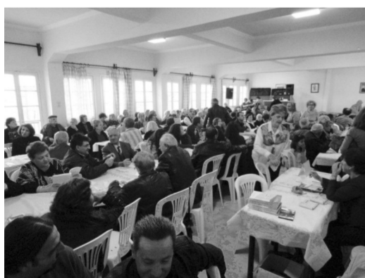
Κατάμεση η αίθουσα και φέτος

Η Ένωσή μας ευχαρίστησε όλους τους παρευρισκόμενους εισπράττοντας και αυτή με τη σειρά της τις καλύτερες ευχές απ' όλους και την υπόσχεση να βρεθούμε και πάλι όλοι μαζί του χρόνου.