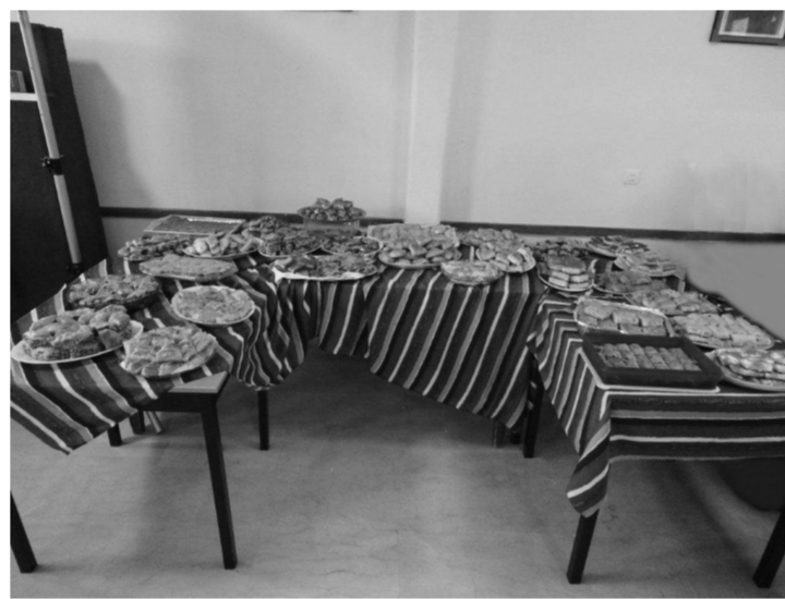
Δημιουργικές νοστιμιές από τις νοικοκυρές του χωριού μας

Το πρωί του Σαββάτου ξεκίνησε η μεγάλη μέρα για μας. Από τις 12:00 το πρωί άρχισαν να έρχονται οι κυρίες με τις πίτες ζεστές και ευωδιαστές και μέχρι την ώρα έναρξης της γιορτής είχαν μαζευτεί 50 πίτες και γλυκά που οι νοικοκυρές του Μεσσηνικόλα αφιερώναν