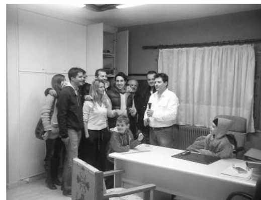
Νέοι του χωριού τραγουδούν τον εθνικό ύμνο