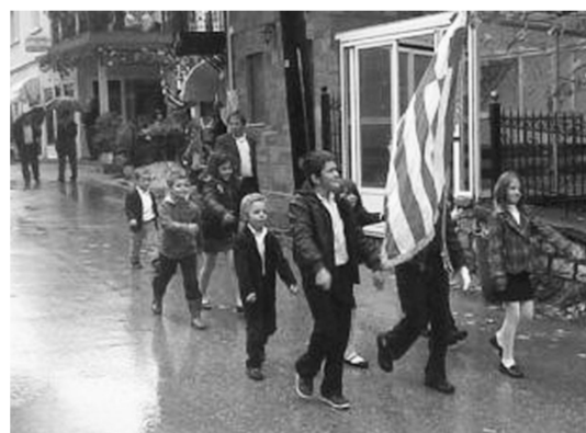
Μαθητές περιελαύνουν περήφανα με την ελληνική σημαία