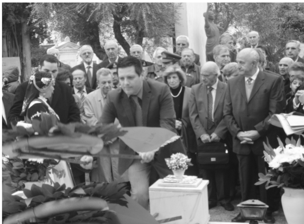
Ο πρόεδρος της Ένωσης καταθέτει στεφάνι στον τάφο του πρωθυπουργού Νικολάου Πλαστήρα

Στη δεύτερη επιμνημόσυνη δέηση στον τάφο του Νικολάου Πλαστήρα, στο έργο, στη ζωή, στις δραστηριότητες και στην προσφορά