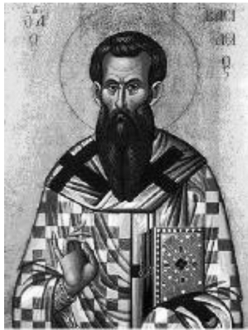
Ο Άγιος Βασίλειος