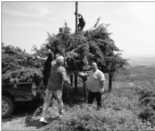
Στιγμιότυπα από τις εργασίες για την κατασκευή του αναφανού

λιο της Αναστάσεως και έψαλαν μαζί το "Χριστός Ανέστη εκ νεκρών".