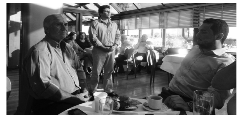
Στιγμιότυπα από την απογευματινή συνάντηση της Ένωσης μας στο ξενοδοχείο Τιτάνια