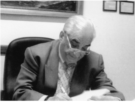
Γράφει ο Εμανουήλ Καζάσης Καρδιολόγος

Ακάθεκτοι αυτοί, κι' εμείς...κουραστήκαμε.