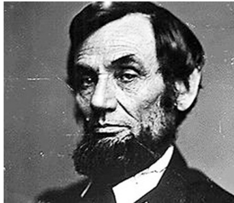
Ο Αβραάμ Λίνκολν

Ενώ το Σύνταγμα των ΗΠΑ δίνει το δικαίωμα στο Κογκρέσο να εκδίδει χρήμα, η Αμερικανική Κυβέρνηση έχει μεταφέρει το δικαίωμα της έκδοσης του χρήματος και μάλιστα με επιτόκιο στο "Federal Reserve" το οποίο δεν