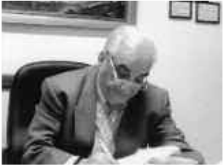
Γράφει ο Εμανουήλ Καζάς Καρδιολόγος

Ωστόσο, τραγουδιστές σκεπάζονται από λουλούδια των ευημερούντων Ελλήνων, ενώ παιδιά πεθαίνουν από το μαγκάλι.