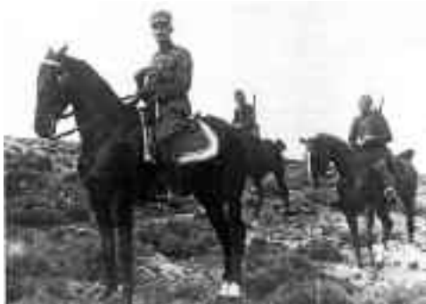
Ο Μαύρος Καβαλάρης

τους σώσαντες την Ελλάδα, αρχηγούς της Επανάστασης, αποφάσισε την προαγωγή τους στο βαθμό του Αντιστράτηγου. Μετά τη δικτατορία του Πάγκαλου, ο Πλαστήρας έφυγε στο εξωτερικό. Τον ανάγκασε ο Πάγκαλος να φύγει, γιατί δεν μπορούσε να ησυχάσει αν έμενε στην Ελλάδα. Η τιμωριά του η ευθιξία του για τα Δημόσια πράγματα, ήταν απαράμιλλη. Όταν ο Υπάσπιστής του Πάγκαλου, Πανσανίας Κατσώτας, τη στιγμή που επιβιβάστηκε ο Πλαστήρας σε αντιτορπιλικό στον Πειραιά για να φύγει, του έφερε το διαβατήριο και 10.000 χιλ. Γαλλικά Φράγκα, ο Πλαστήρας αγανακτισμένος και αποθώντας τα χρήματα του είπε: «Πάρτα πίσω, κανένας δεν έχει δικαίωμα να αγγίζει το Δημόσιο χρήμα».