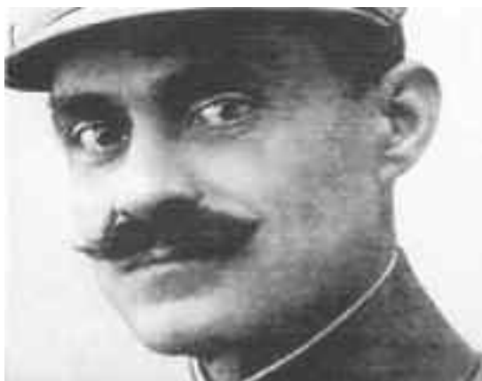
Ο Νικόλαος Πλαστήρας

Ήταν γενναίος, δίκαιος, τολμηρός και αποφασιστικός. Έκλεινε μέσα του μια φλόγα δυναμική, που εγχυμονόσε ηφαιστειο, που δεν άργησε να εκραγεί. Στα παιδικά του χρόνια, έδειρε κάποτε το παιδί του Τούρκου πασά της Καρδίτσας, γιατί το Τουρκόπουλο, πάνω στα παιχνίδια τους, έδειρε ένα Ελληνόπουλο και οι γονείς του φοβούμενοι την εκδίκηση του πασά, τον φυγάδευσαν στην Αθήνα. Εκεί φοίτησε στη Βαρθολομαίου Σχολή. Μετά από λίγα χρόνια, ξαναγύρισε στη Καρδίτσα και συνέχισε εκεί τις σπουδές του. Σε ηλικία 19 ετών τελείωσε