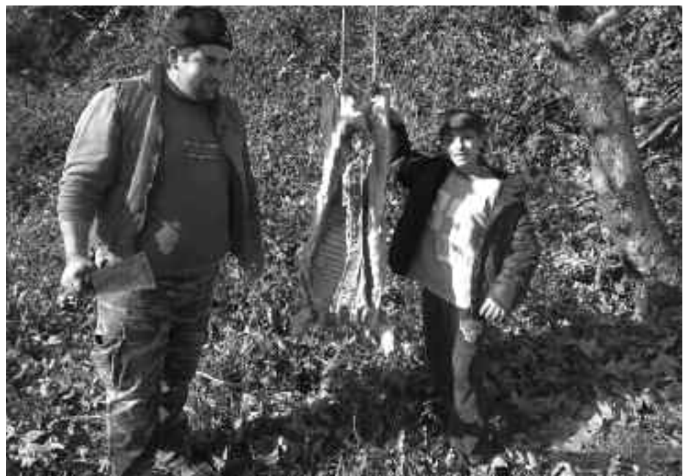
Έσκουξε του γρούνι!