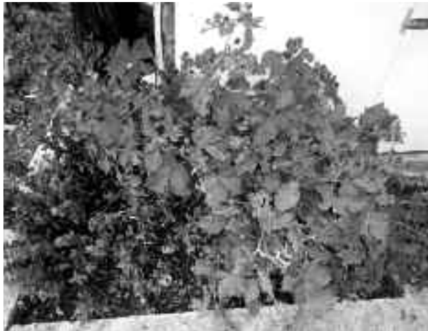
Βατομουριά φορτωμένη καρπός