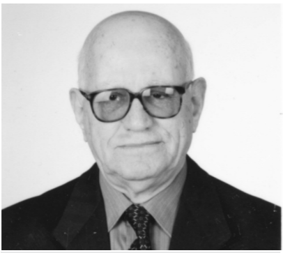
Γράφει ο: Χρήστος Γ. Κοτρότος