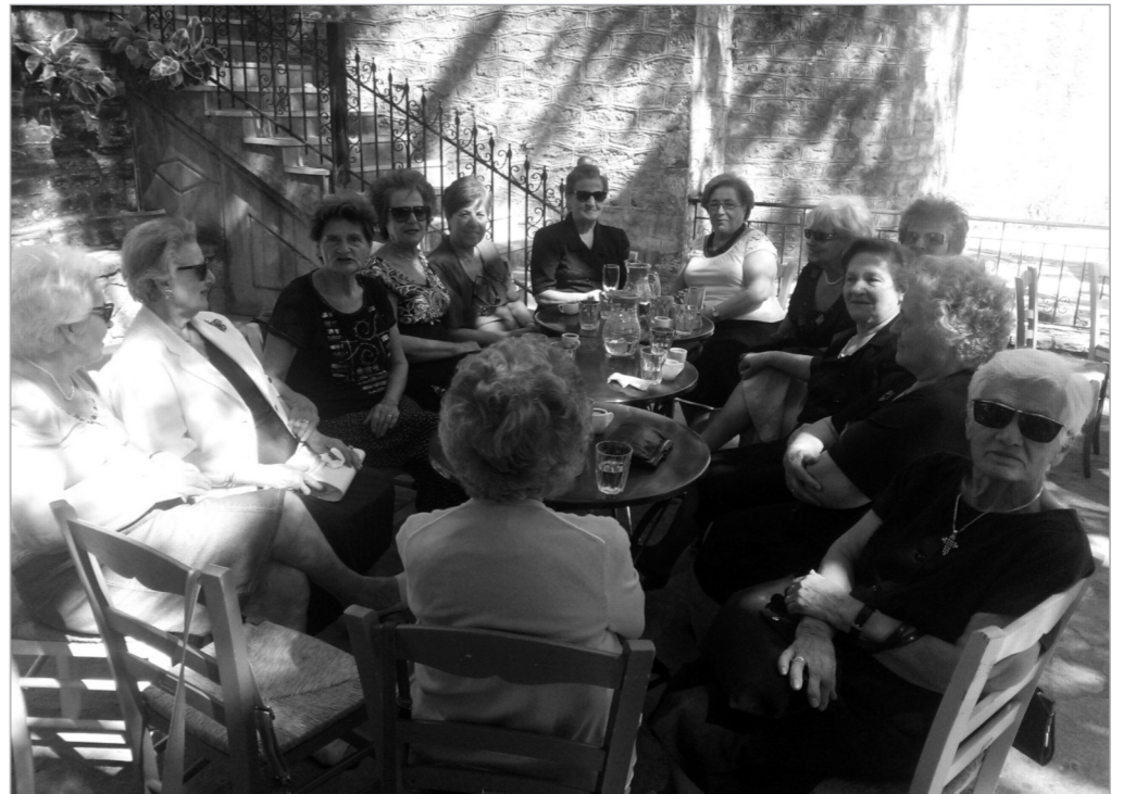
Παρέα κυριών στην "Πάνω πλατεία του χωριού", «βγαλμένη» από τα παλιά