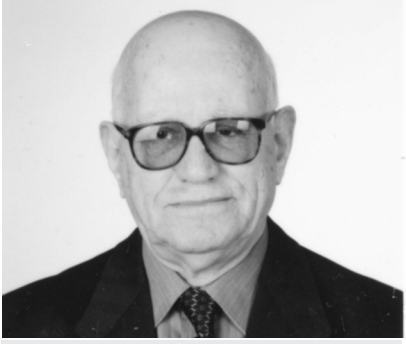
Γράφει ο: Χρήστος Γ. Κοτρώτσιος

Αγαπητοί συγχωριανοί και φίλοι, Με τη ραστώνη των διακοπών, σημειώσα λίγα πράγματα: Φροντίζω να ακολουθώ το λεγθέν του Γερόντος Μεσσηνικόλα: «Για χίλια που ξέρεις και ένα που δεν ξέρεις, φάτα, για... να μαθαίνεις». (Λαϊκή παροιμία) - Γράφω λίγα, αν υπάρξει χώρος στη «ΝΕΒΡΟΠΟΛΗ» μας. Α. Αρχίζω από την ονομαστή – αρχαία ΠΑΡΟ, πατρίδα του Σοφιστή = φιλόσοφου, Προδίκου, του βου π.Χ. αι. - Υπήρξε ο επινοητής, του αληθινού ιστορικού – «μύθου», για το γνωστό στους πολλούς «Σταυροδρόμο». Ηρακλής, ο γνωστός, ημίθεος – ήρωας, με τους άθλους του, «έφηβος γενόμενος, εν απορία ήν ποίαν οδόν επί τον βίον τράποιτο» = (να βαδίσει!). Τον της καϊκίας, ή τον της Αρετής. Προτίμησε τον δεύτερο. Εδώ, στην Παροικιά – χώρα της ΠΑΡΟΥ, του νομού ΚΥΚΛΑΔΩΝ, έκτισε το 333 μ.Χ. η ευσεβής χριστιανή Ελένη, μητέρα του Μ. Κωνσταντίνου (313 – 337 μ.Χ.), Αυτοκράτορα Ρώμης, και από 313 (Διάταγμα Μεδιολάνου, περί ανεξίτησης), της Νέας Ρώμης – Κων/πολλής, όταν πήγαινε η Αγία ΕΛΕΝΗ, με καράβι της εποχής, στους Αγίους Τόπους – (Ιερουσόλυμα), να ανασκάψει και να ανεύρει τον Σταυρό του Σωτήρος – ΧΡΙΣΤΟΥ και να οικοδομήσει Ναούς Αναστάσεως, Αναλήψεως, Γεννήσεως του Χριστού και άλλους. Λόγω φοβεράς θαλασσοταραχής – τρικυμιών, έμεινε στην ΠΑΡΟ επί τριήμερον. Τότε έκτισε εδώ, για οικοδομήσει Ναούς Αναστάσεως, Αναλήψεως, Γεννήσεως του Χριστού, του Χριστού, ΕΚΑΤΟΝΤΑ-