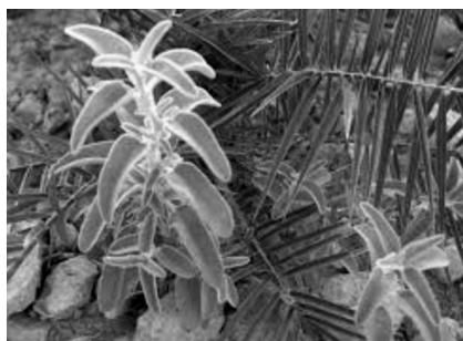
του γίνεται τις πρώτες ημέρες του Μαΐου πριν βγει ο ήλιος. Ας δούμε καλύτερα τι μας προσφέρει το

Το λατινικό του όνομα σημαίνει σάλβια ο θεραπευτής, ο σωτήρας. Στην Αρχαία Ελλάδα ήταν ιερό βότανο, γιατί μπορούσε να σώσει τη ζωή ενός ανθρώπου, καθώς το χρησιμοποιούσαν σε δαγκώματα φιδιών. Οι Γάλλοι το λένε Ελληνικό τσάι και το χρησιμοποιούν στην παρασκευή φαρμάκων. Οι Κινέζοι το λένε ιερό βότανο, Ελληνικό βλαστάρι και το θεωρούν πολύ καλύτερο από το δικό τους τσάι. Η παράδοση των Άγγλων λέει ότι το φασκόμηλο φυτρώνει σε κήπους σοφών. Στην χώρα μας είναι ονομαστό το φασκόμηλο της Κρήτης. Η συγκομιδή