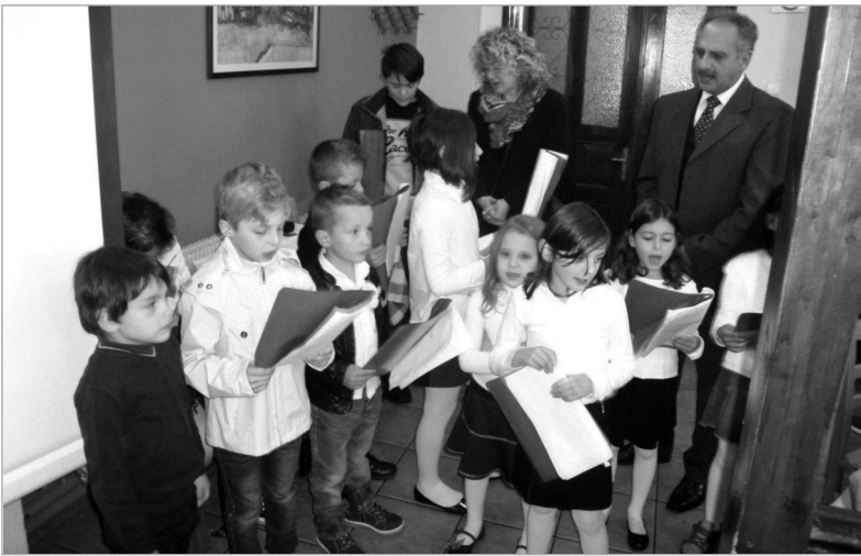
Τα παιδιά του Δημοτικού Σχολείου και Νηπιαγωγείου Μεσενικόλας

Με βροχερό καιρό γιορτάστηκε στο χωριό μας η επέτειος του ΟΧΙ. Μετά την καθιερωμένη δοξολογία έγινε κατάθεση στεφάνων από τον Δήμο, την Τοπική Κοινότητα, το Δημοτικό σχολείο και το Νηπιαγωγείο του χωριού μας. Ακολούθησε μια συγκινητική και όμορφη σχολική γιορτολόγια στην καφετέρια. Και του χρόνου να είναι τελετά καλά. Δυστυχώς λόγω της βροχής που έπεφτε ασταμάτητα δεν τελέστηκε η παρέλαση των μικρών μαθητών.