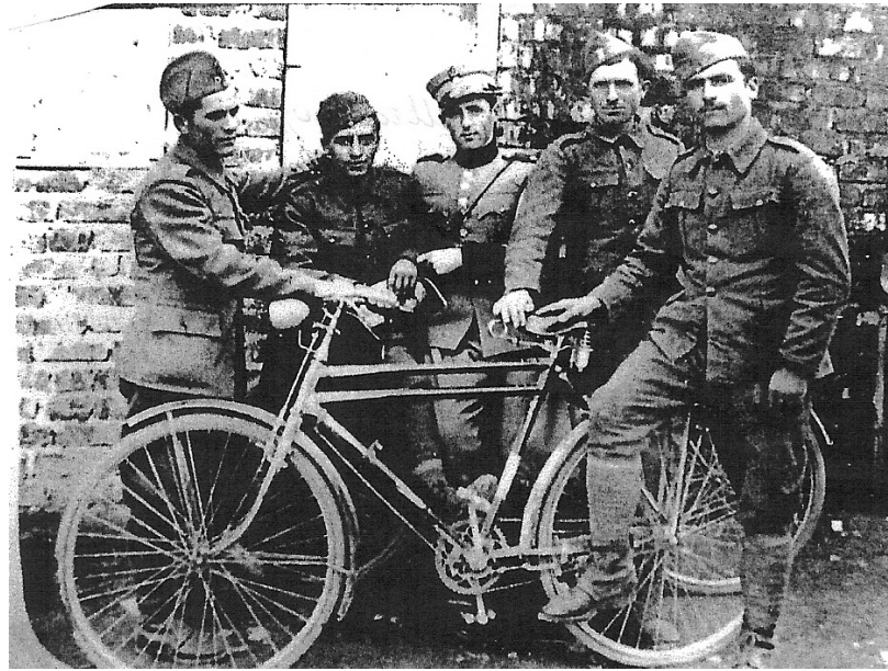
Φαντάρι από τον Μεσενικόλα

Στη διοίκηση των ανταρτών συμμετείχε συμβουλευτικά ο συνταγματάρχης Δημήτριος Πετρούλακης πρώην υπασπιστής του βασιλιά Γεωργίου. Ο Πετρούλακης που συμπτωματικά έτυχε να βρίσκεται στην περιοχή όπως και οι μόνιμο αξιωματικοί Νικήτας Γιώργος επιλαρχος και Ιατρούλης Θανάσης αντισυνταγματάρχης συνεργάστηκαν στενά με τους διοικητές των ανταρτών Ζαρογιάννη και Μπουκοβάλα στα σχέδια των επιχειρήσεων. Ο Νικήτας ανέλαβε μάλιστα με επιτυχία τον χειρισμό του μοναδικού όλμου, που χωρίς σκοπευτικό μηχανισμό και με λιγότερα από σαράντα βλήματα είχαν οι αντάρτες. Αλλάζε διαρκώς τη θέση του όλμου για να νομίζουν οι