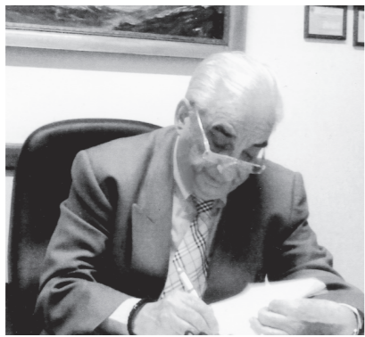
Γράφει ο Εμανουήλ Καζάς ΙΑΤΡΟΣ ΚΑΡΔΙΟΛΟΓΟΣ

Ποιος το λέει αυτό και πότε. Ο γιατρός, ο δικηγόρος, ο μηχανικός, ο τεχνοκράτης, και ο πολιτικός με διορατικότητα, ήθος, ποιότητα και δύναμη.