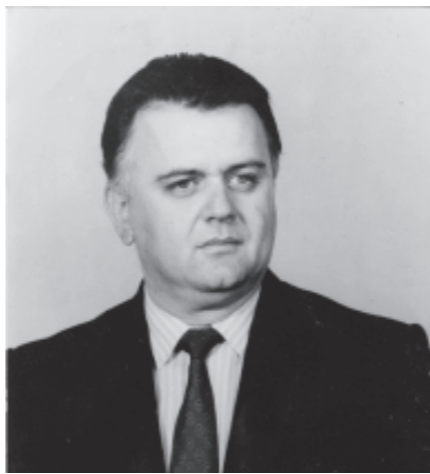
Νομικά και Πολιτικές Επιστήμες. Είναι κάτοχος διδακτορικού διπλώματος του