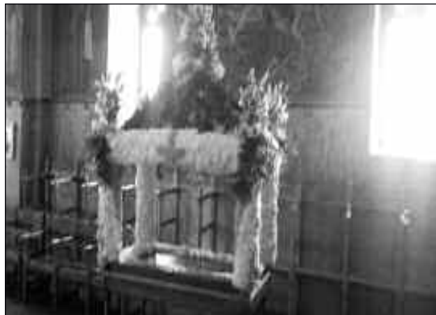
Ο Επιτάφιος του χωριού του 2017

Το Δ. Σ. της Ένωσης Μεσενικολιτών Αθηνών αποφάσισε να αναβάλει τη γιορτή "Παραδοσιακής πίτας" που ήταν προγραμματισμένη να γίνει το τριήμερο του Αγίου Πνεύματος μιας και φέτος πέφτει η εξεταστική περίοδος των μαθητών τις ημέρες αυτές και έτσι η συμμετοχή δεν θα ήταν η αναμενόμενη.