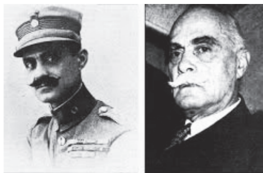
Ο Νικόλαος Πλαστήρας

Πρόεδρος Ομοσπονδίας Θεσσαλικών Σωματείων η «Πανθεσσαλική Στέγη» Εξήντα τέσσερα χρόνια πέρασαν από την ημέρα που έφυγε από τη ζωή ο μεγάλος αγωνιστής, γενναίος πολεμιστής και ο αγνός άνθρωπος Νικόλαος Πλαστήρας. Υπέστη εγκληματικό επεισόδιο και πέθανε στην Αθήνα στις 26 Ιουλίου 1953 κρατώντας στην τσέπη του μόνο 53 δραχμές. Πέθανε φτωχός, αγωνιζόμενος των υπέρ βωμών και εστιών αγώνα, τον αγώνα της Εθνικής Ανεξαρτησίας και της κοινωνικής δικαιοσύνης. «Ο Πλαστήρας, δίνεται τις να είπα ότι εφότισε το στερέωμα του Ελληνικού ουρανού δι' άπλετον φωτός και ότι απέδωσε εις το Έθνος την αυτοπεποίθησή, ήτις τόσον επικανδύνως είχαν κλονισθή μετά την καταστροφήν της Μ. Ασίας. Έθνος το οποίον εις κρίσιμους στιγμάς εμφανίζει άνδρας, δύναται να αποβλέπει μετ εμπιστοσύνης εις το μέλλον», Ελ. Βενιζέλος (1924). Γεννήθηκε στην Καρδίτσα το 1883. Από παιδί διακρινόταν για την εξυπνάδα και την τόλμη του. Από μικρός έδειχνε τις ηγετικές του ικανότητες και το ταλέντο του για τα πολεμικά πράγματα. Η προσφορά του στο στρατό υπήρξε ανεκτίμητη και η βαθμολογική του εξέλιξη