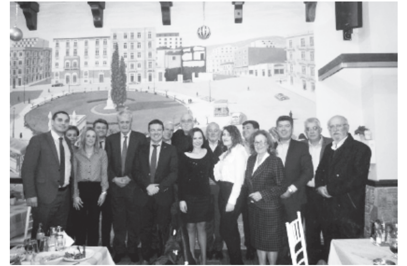
Το Δ.Σ. του Συλλόγου των Απανταχού Καρδιτσιωτών και τα μέλη της αποστολής της Συνεταιριστικής Τράπεζας Καρδίτσας σε κεντρικό Καρδιτσιώτικο εστιατόριο των Αθηνών, όπου και διεπνήσαν μετά την εκδήλωση

Την εκδήλωση τίμησαν με την παρουσία τους, μεταξύ των πλήθους των Καρδιτσιωτών, ο πρ. Πρόεδρος της