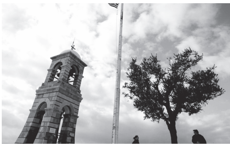
«Ην αννηοοσύν Αγγελοι Θεου- αντή υπάχει σκηνή επουράνιος»

Την Χάριν συνεισάγουσα, την εν τω πνεύματι θείω.