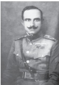
Της Νικόλαος Πλαστήρας

Ο Αρχιστράτηγος των Συμμάχων, Στρατηγός Γκνινομά, διέταξε το Δκτ της 1ης Ο.Μ. να εκτελέσει επίθεση ευρείας κλίμακας, με σκοπό την αριστοποίηση όλων των εχθρικών δυνάμεων που υπήρχαν στο Μακεδονικό Μέτωπο. Αντικειμενικός σκοπός της επίθεσης του Σκρα ντε Λέγκεν, που ήταν στον τομέα του Σκρα (χωριό). Η απόφαση αυτή υπαγορεύθηκε από τη διαμόρφωση της εχθρικής γραμμής, η οποία είχε γενική κατεύθυνση από δυτικά προς τα ανατολικά, στις νότιες υπώρειες του όρους Τζένα, έκανε μια καμπή προς νότον από τη Χούμα, μέχρι το Σκρα ντε Λέγκεν, και απ' εκεί έκανε απότομη στροφή προς βορρά, δηλαδή αποτελούσε μια