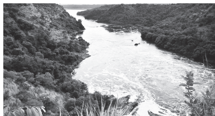
Ο ποταμός Νείλος

Ο Ναός, αυτός είναι κάτι το μυστηριακό και απερίγραπτο. Ο Διοκλιτιανός δημιούργησε το προθάλαμο του, ο Μ. Αλέξανδρος το Άδυτο και ο Πτολεμαίος ο Γ' τη θριαμβευτική πύλη. Πίσω απ' αυτόν υψώνεται ο μναρές του τζαμιού του Αμπούλ-Χαγκάκ. Ένας φαρδύς δρόμος 2 χιλιομέτρων περίπου, ενώνει το συγκρότημα αυτό με το ναό του Καρνάκ, που πλαισιώνεται από κριοκέφαλες Σφίγγες. Ένας τεράστιος οβελίσκος ορθώνεται μπροστά στην είσοδο. Ήταν δύο. Ο δεύτερος βρίσκεται σήμερα στημένο στη πλατεία ΚΟΝ-ΚΟΡΤ στο Παρίσι. Τους οβελίσκους ίδρυσε η Βασίλισσα Χανσεφούτ της 18ης δυναστείας. Σε ένα ιστόρημα της εποχής γράφεται ότι ο θεός Αμόν-Ρα (ήλιος) μέθυσε κάποτε, από την ομορφιά της μητέρας της Αμεσίδας, κοιμήθηκε μ' αυτή και