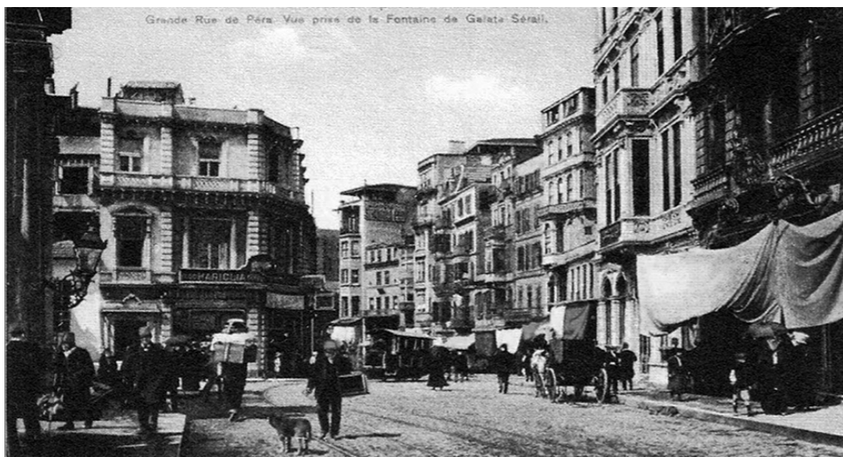
Η συνοικία του Πέραν

Μεγάλο Σάββατο Πρωί. Έξω βρέχει δυνατά και όμως τίποτε δεν μας κρατά. Βαδίζουμε για την Εκκλησία, την Παναγία του Πέραν. Μεγάλη μας ήταν η επιθυμία να μεταλάβουμε στη πόλη. Παρατηρούμε στη διαδρομή μας τα γύρω κτίρια. Έχουν όλα γενικά ένα γκριζο, μουντό χρώμα και είναι εξωτερικά απεριποίητα και ακαλαίσθητα. Οι σταλαμίδες που τα λούζουν, κάνουν το χρώμα τους πιο μουντό και άχαρο. Ο ουρανός βαριά συννεφιασμένος, εξακολουθεί να ρίχνει τώρα πιο δυνατή βροχή. Ένας αέρας παγερός φυσά και μας προουνιάζει ως το κόκαλο.