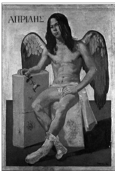
Πίνακας του Γιάννη Τσαρούχη

Στο αρχαίο Αττικό ημερολόγιο ο Μάρτιος αντιστοιχούσε με το δεύτερο δεκαπενθήμερο του μήνα Ελαφηβολιών και το πρώτο δεκαπενθήμερο του μήνα Μουνυχώνα. Το διάστημα αυτό στην Αθήνα γιορτάζονταν τα: • Γαλάξια, προς τιμή της Ρέας. • Ελαφιβόλια, προς τιμή της θεάς Αρτέμιδος. • Μουνύγια, προς τιμή της Θεάς Αρτέμιδος. • Δελφίνια, προς τιμή του Απόλλωνα και της Αρτέμιδος.