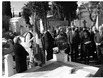
Ο Δήμαρχος Λίμνης Πλαστήρα εκφωνεί λόγο στην εκδήλωση για τη ζωή και το έργο του Πρωθυπουργού Ν. Πλαστήρα..