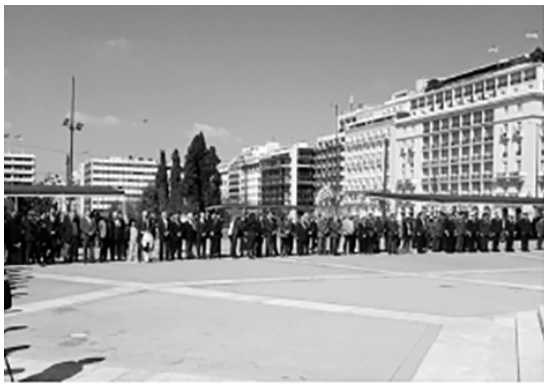
Οι πολιτικές, στρατιωτικές και αυτοδιοικητικές Αρχές της Ελληνικής Πολιτείας στην επίσημη εκδήλωση για την Επέτειο της 25ης Μαρτίου 1821.

Μικτό τιμητικό άγημα των Ενόπλων Δυνάμεων και η μπάντα του Γενικού Επιτελείου Αεροπορίας απέδωσαν τις δέουσες τιμές. Ο Σύλλογος των Απανταχού Καρδιτσιωτών εύχεται στους Απανταχού της Γης Έλληνες και Καρδιτσιώτες, Χρόνια Πολλά!