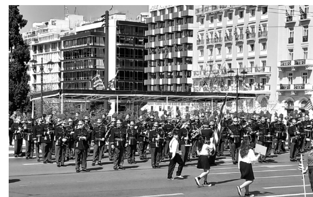
Η μαθητική παρέλαση στην Αθήνα υπό τους ήχους της εντυπωσιακής Φιλαρμονικής του Δήμου Αθηναίων.