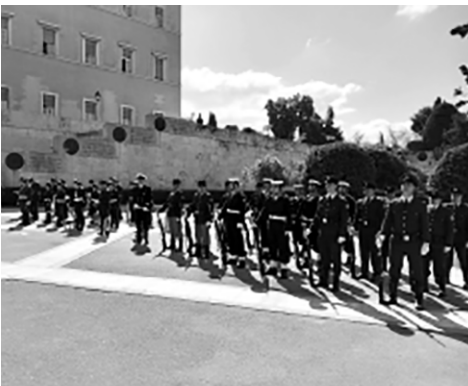
Μικτό στρατιωτικό άγημα των Ενόπλων Δυνάμεων και η Φιλαρμονική της Πολεμικής Αεροπορίας αποδίδουν τιμές.