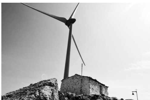
Ανεμογεννήτριες πάνω στο εκκλησάκι του Προφήτη Ηλία στην Τροϊζιγιά

Τα αιολικά πάρκα στα Άγραφα είναι έργα με τεράστιες περιβαλλοντικές και κοινωνικές επιπτώσεις. Η διάνοιξη δρόμων έχει δώσει εκατοντάδες κατολισθήσεις στο γεωλογικό υπόβαθρο, γνωστό ως «φλύσχης των Αγράφων». Θυμίζουμε επίσης ότι με τα ακραία καιρικά φαινόμενα «Ιανός» και «Daniel», δημιουργήθηκαν πρωτοφανείς χείμαρροι και προκλήθηκαν αμέτρητες κατολισθήσεις στα βουνά και τα χωριά μας με καταστροφές υποδομών, δρόμων, σπι-