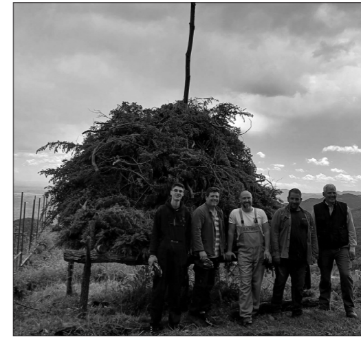
Του Χρυσόστομου Καρβούνη

Και φέτος στο Μεσενικόλα αναβίωσε το έθιμο του Αναφανού του αναφανού ανήμερα της Αναστάσεως του Κυρίου.