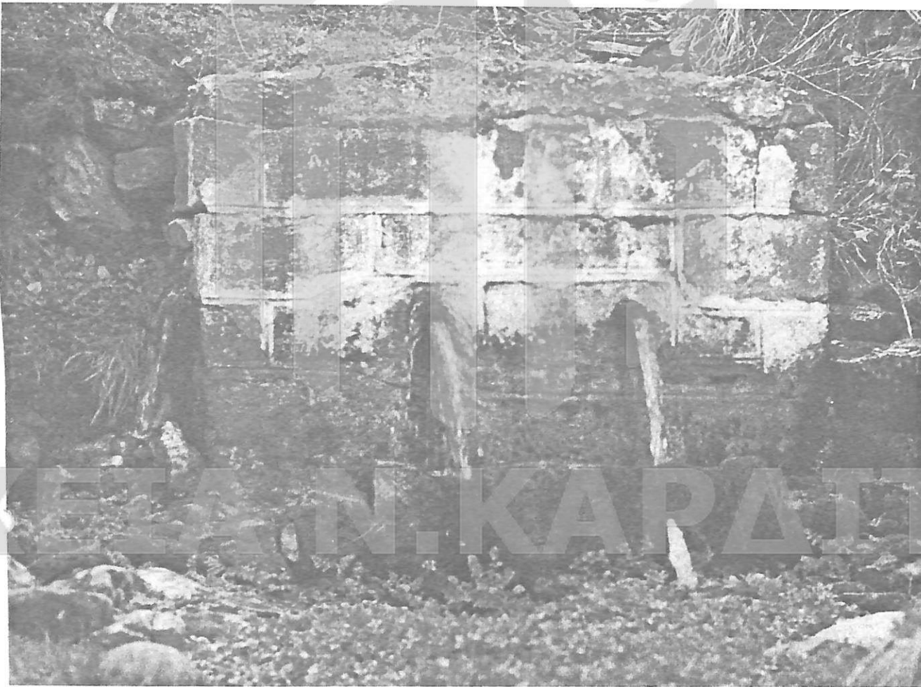
Η παλιά βρύση της Κασσάνδρας

με τα ρούχα βουτούσαμε στη νέα κολυμπήθρα της φύσης. Παίζαμε, τσακωνόμασταν, βρίζαμε, γελούσαμε και σκοτώναμε μπακακάκια και γυφτόψαρα με το λάστιχο. Περνούσαν ώρες ολόκληρες, μέχρι να μας ψάξουν και να μας κυνηγήσουν οι μανάδες μας. Η γούρνα της Κασσάνδρας ήταν η δίκη μας θάλασσα, ο δικός μας ωκεανός.