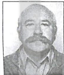
Γράφει ο Αθανάσιος Τσιαμαντάς

Όσο πλησιάζουν οι μέρες του Πάσχα ζουν έντονα μέσα μου παλιές αναμνήσεις από έθιμα που