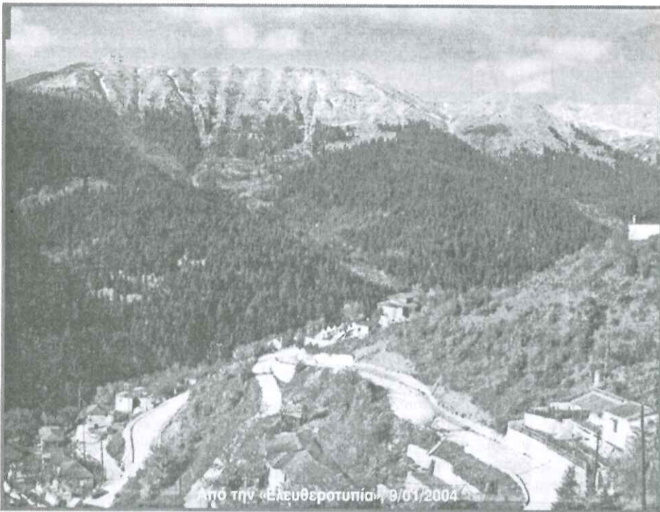
Από την «Ελευθεροτυπία» 9/01/2004

Ο γυρισμός στα γενέθλια χώματα χαρίζει στις ψυχές των ανθρώπων γαλήνη και νοσταλγία. Ο τόπος που μας γέννησε καλωσορίζει και αγκαλιάζει όλα τα παιδιά του, που βρίσκονται στις άγνωστες πολιτείες. Τα έρημα σπίτια