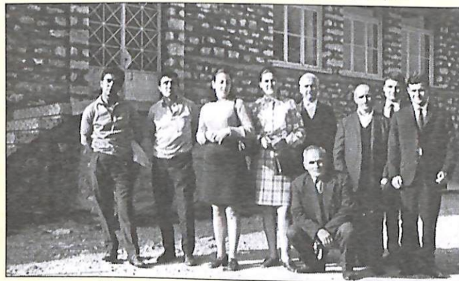
Με νέους και φίλους του χωριού

Από την επίσκεψη αυτή είναι η φωτογραφία