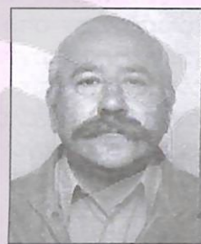
Γράφει ο Αθανάσιος Τσιαμαντάς

Ένα επάγγελμα που γνώρισε δόξες και δόξες ήταν αυτό του τσαγκάρη