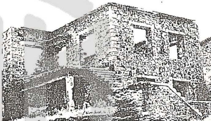
Το ερειπωμένο κτήριο του βιομηχάνου Ι. Κατσάρη στη Νεράιδα Καρδίτσας όπου είχε εγκατασταθεί κατά την κατοχή.

τους Άγγλους και οι ευρισκόμενοι στην Ελλάδα Ιταλοί γίνονται πλέον εχθροί των Γερμανών αφού υπογράφουν συμφωνία με τους Άγγλους στις 13 Σεπτεμβρίου 1943. Η Μεραρχία Πινερόλο μετακινείται στην περιοχή Πύλης (Πόρτα) Τρικάλων αριθμεί περίπου 9.000 άνδρες και ανασυγκροτείται. Αφοπλίζεται όμως από την 1η Μεραρχία του ΕΛΑΣ την νύχτα 15/16 Οκτωβρίου 1943 και όλο το υλικό της Μεραρχίας και ο οπλισμός περιέρχεται στον ΕΛΑΣ.