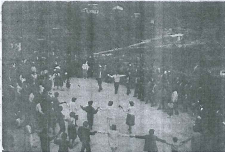
Στιγμιότυπο από τον παραδοσιακό χορό του Πιάσχα

— Στις 12 του Μάη ο σύλλογός μας πραγματοποίησε εκδρο-